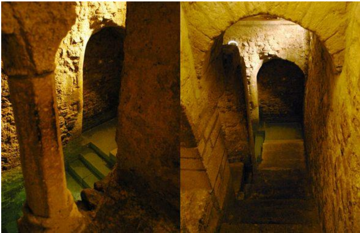
Mikvé de Montpellier XIII