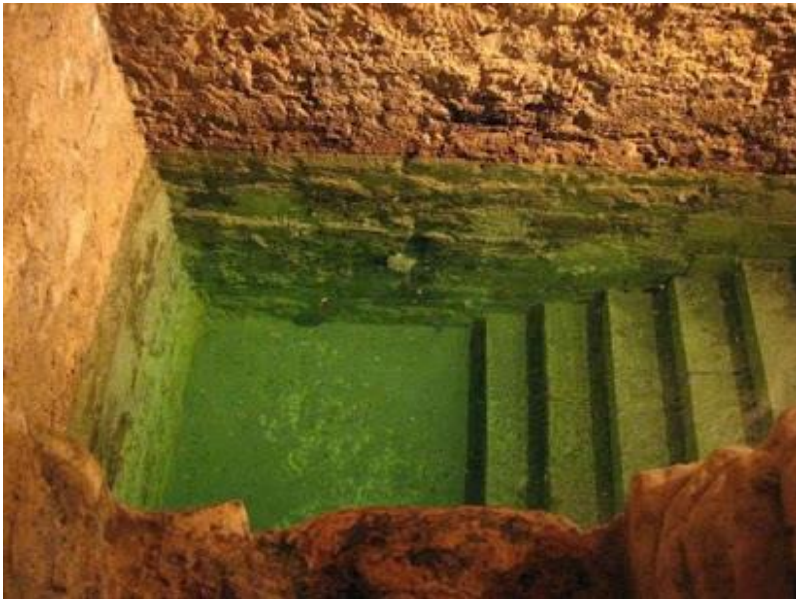
Les 7 marches du bassin