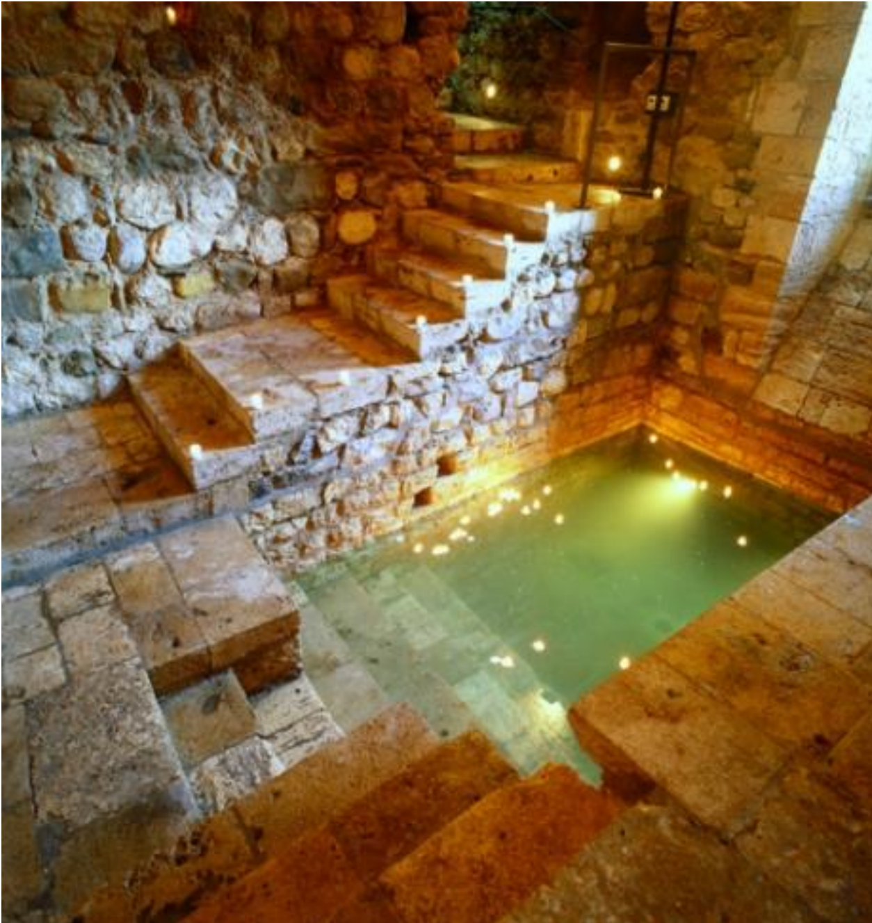
Mikvé de Besalu XIII